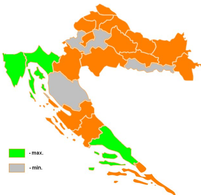
Karta 1: Županije s najviše i najmanje bratimljenja

Od lokalnih jedinica gradovi, u odnosu na općine, imaju znatno više pojedinačnih bratimljenja. Niz predvodi Zagreb sa 11 europskih bratimljenja, za njim slijede Vinkovci (9), Varaždin (8), te Split, Šibenik, Osijek i Pula (6). Pritom, važno je napomenuti da spomenuti gradovi, kao i većina onih koji su do sada ostvarili bratimljenje, imaju bratimljenja koja uključuju i gradove izvan Europske unije, a što nije bilo predmetom ovoga istraživanja. Od općina, prvo mjesto s najviše europskih bratimljenja zauzima općina Cestica (Varaždinska županija) – 7 bratimljenja koje je uspostavila sa slovenskim općinama.